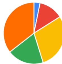
Welke periode heeft de voorkeur?