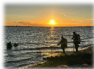
Type duiken bij verblijf aan land?