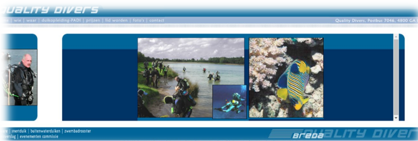
Website van Quality-Divers in 2002