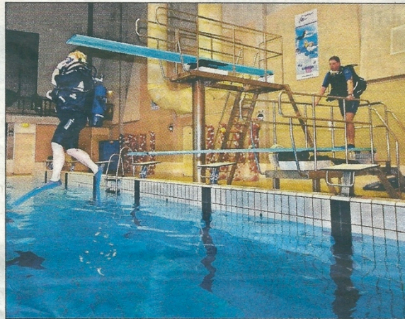
Duikers van duikvereniging Quality Divers trainen vanaf de duikplanken van zwembad De Wisselaar.