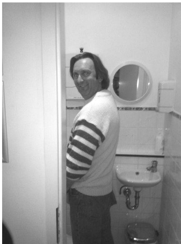
A3 op zoek naar een nieuw lid?